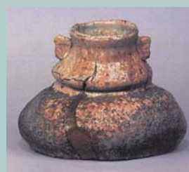
伊賀水指 銘「慾袋」 1940(昭和15)年 石水博物館蔵

川喜田半泥子のすべて展 6月8日(火)〜7月25日(日) 午前9時30分〜午後5時 三重県立美術館(月曜休館)