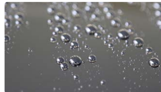
水を弾き、水滴が玉のようになり水切れがよくなります。