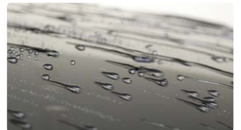
水滴がコロコロ落ち、セルフクリーニング効果が期待できます