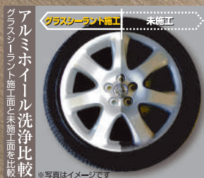
アルミホイール洗浄比較 ガラスシーラント施工前・施工後